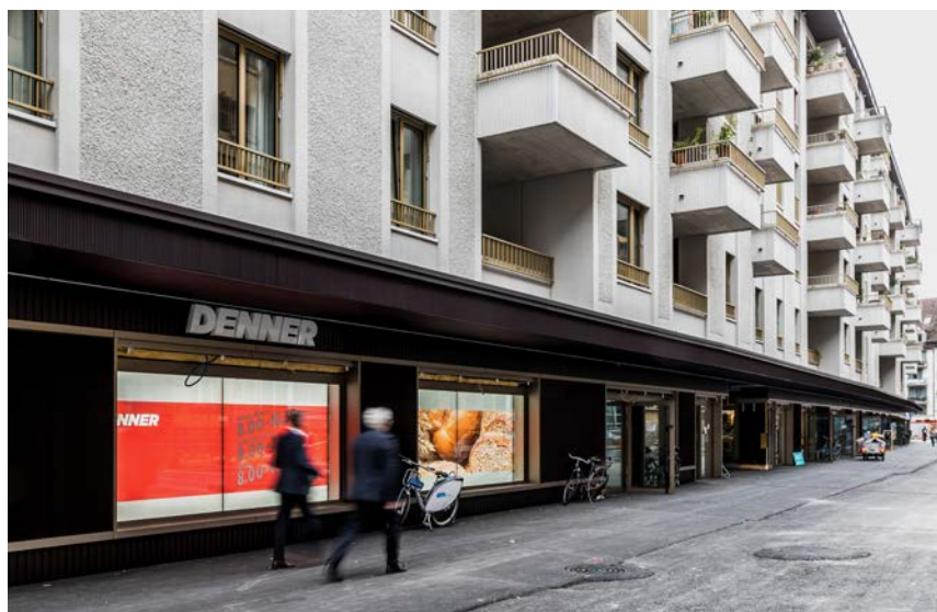
Die Läden und Lokale im Erdgeschoss werden zur Belegung des Neustadtquartiers beitragen.