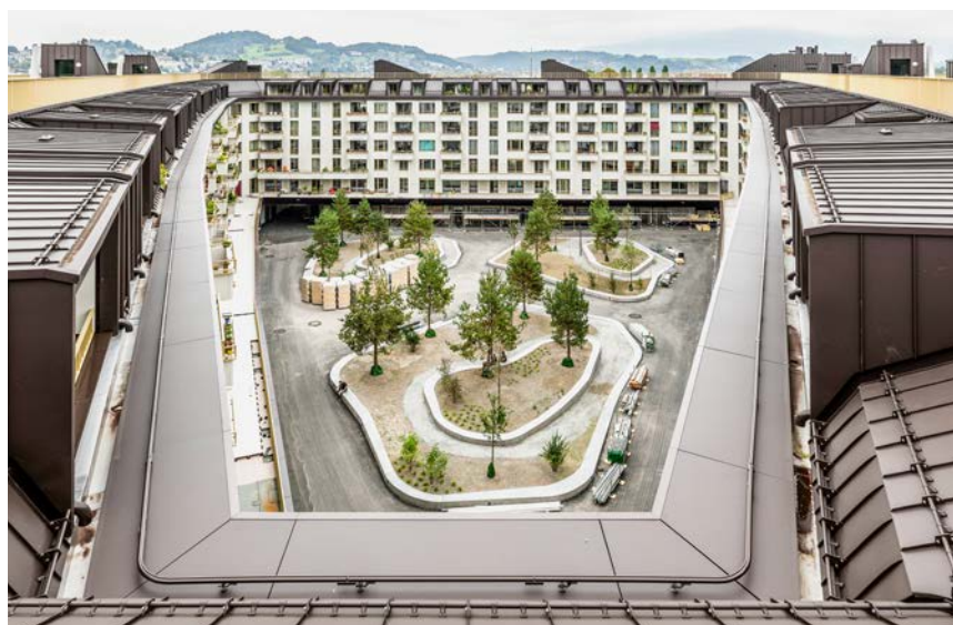
Wegen der darunterliegenden Einstellhalle ist der Wurzelraum für die Hofbepflanzung beschränkt. Der Landschaftsarchitekt setzte deshalb auf eine Bergflora – die drei Erhebungen nehmen darauf Bezug.