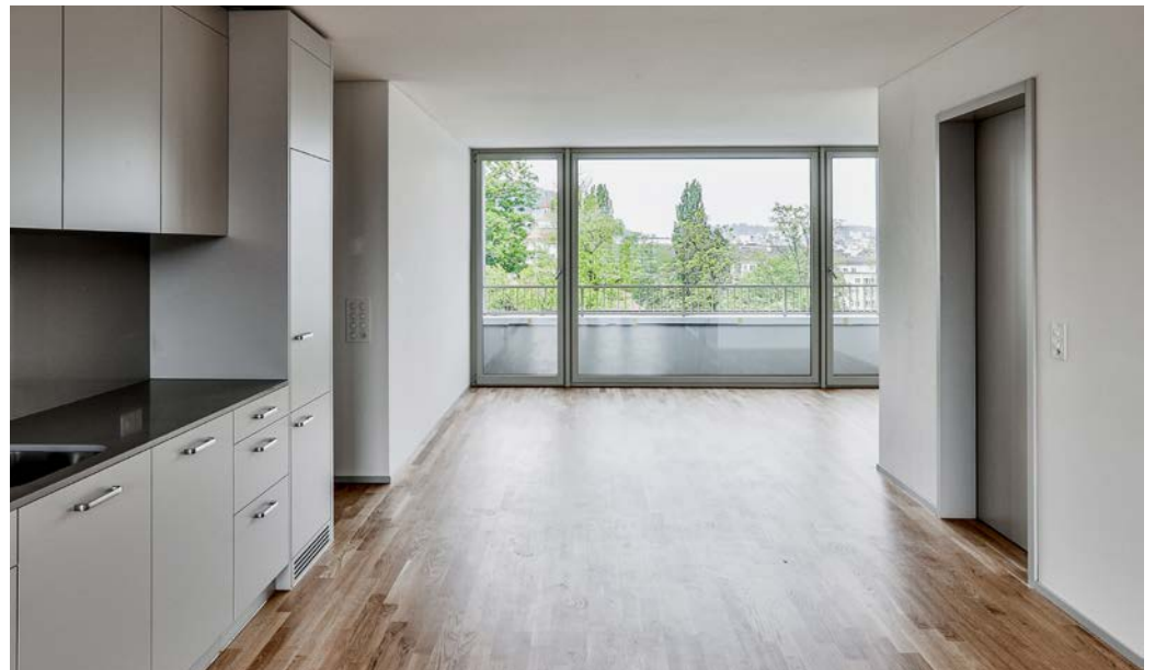
Einblick in verschiedene Wohnungstypen.