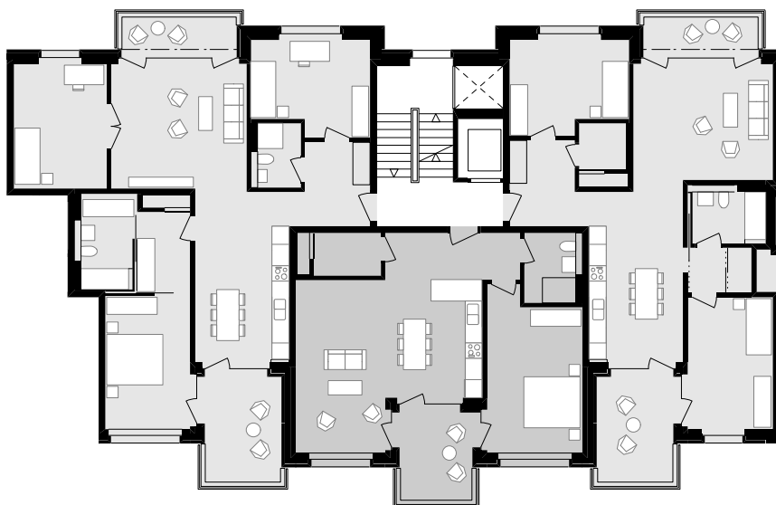
Dreispanner-Regelgrundriss mit je einer 2 ½-, 3 ½- und 4 ½-Zimmer-Wohnung.