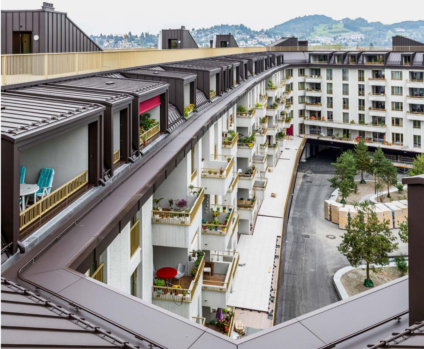
Blick in den Hof mit dem aluverkleideten Dachgeschoss und der durchlaufenden 300-Meter-Dachterrasse. Die Lukarnen bestehen aus vorgefertigten Holzelementen.

Allgemeine Baugenossenschaft Luzern (abl) stellt erste Etappe der Ersatzneubauten Himmelrich 3 fertig